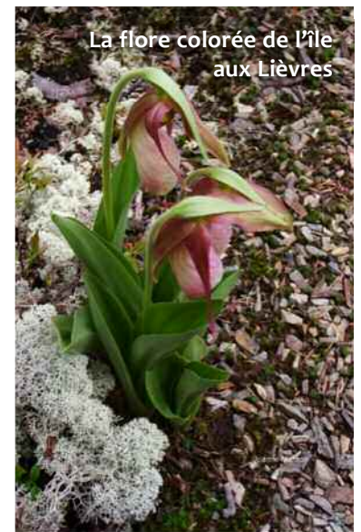
La flore colorée de l'île aux Lièvres

Nous avons passé un séjour encore une fois mémorable sur l'île. Du temps de qualité pour observer ce qui nous entoure, du temps pour refaire le plein d'énergie et bien se reposer. Un havre de paix avec sa faune et sa