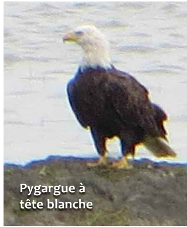
Pygargue à tête blanche

À la pointe aux Pins où se reposent en migration Parulines bleues, à joues grises, flancs marron, à tête cendrée et la bien nommée Paruline des ruisseaux, justement les pattes dans l'eau, les bois sombres cachent aussi bien Petite Nyctale, moyen et grand ducs que le délicat et inoubliable Papillon lune. Patiente et silencieuse, j'y ai déjà rencontré une biche complaisante.