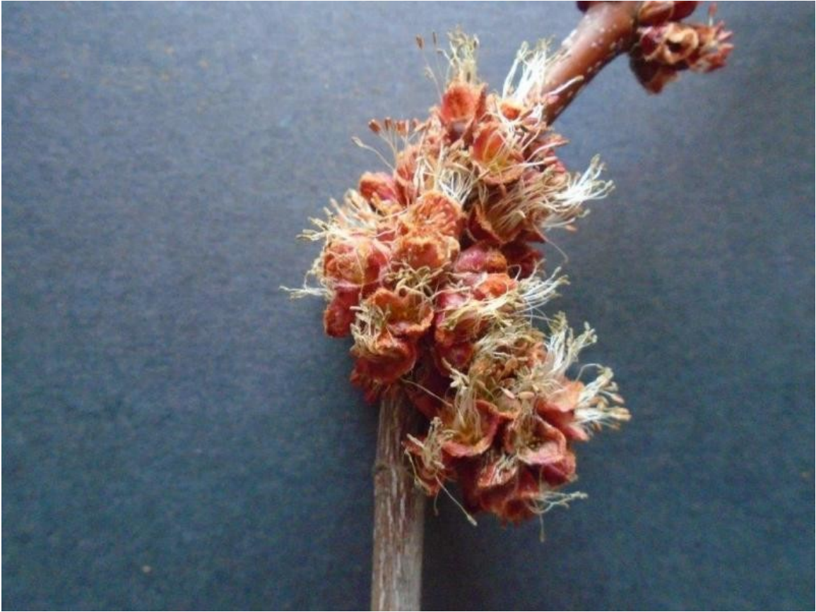
Figure 3: Érable, fleurs staminées.