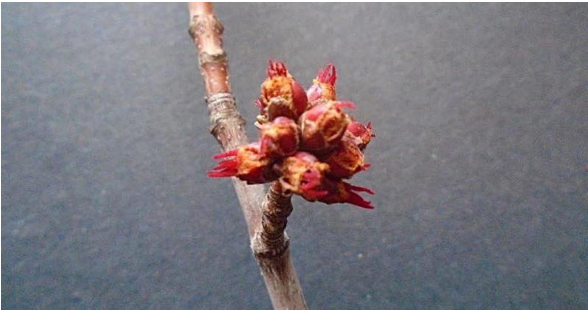
Figure 2: Érable, fleurs carpellées